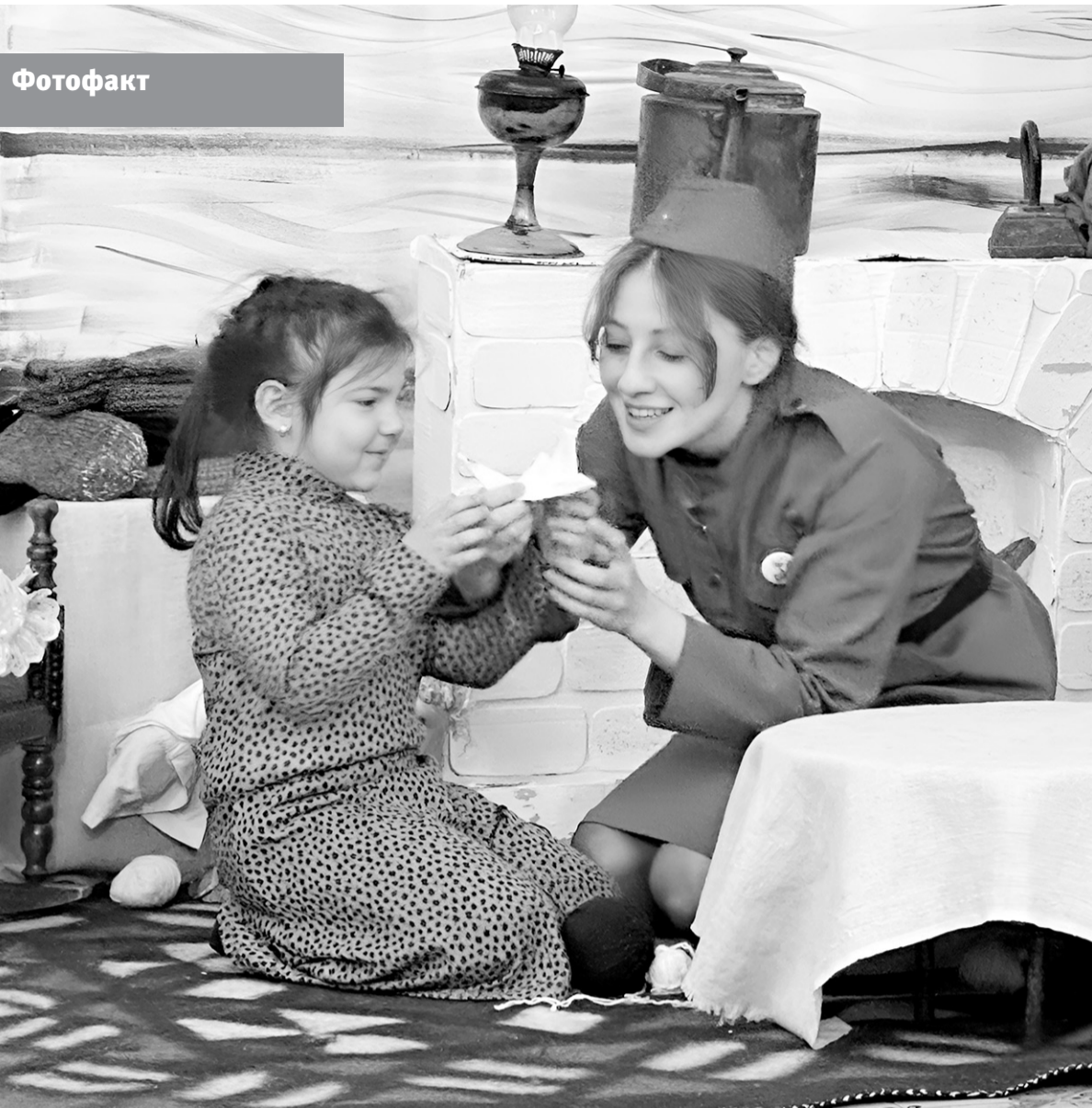
С 7 по 18 апреля в общеобразовательных учреждениях Карачаевского городского округа проходил городской смотр самодеятельного художественного творчества среди учащихся, посвящённый 80-летию Великой Победы. Его участники пели, танцевали, читали стихи, представляли инсценировки... И нужно было видеть, сколько искренних чувств было вложено в каждое выступление!