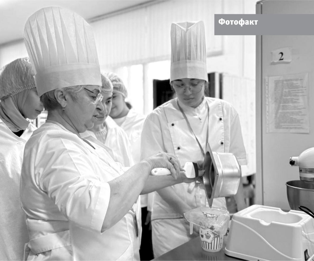
В Карачаево-Черкесии состоялся Единый день открытых дверей в рамках федерального проекта «Профессионалитет». В Колледже индустрии питания, туризма и сервиса в этот день более 100 школьников 8–11 классов общеобразовательных организаций республики познакомились с системой среднего профессионального образования, образовательными программами, реализуемыми в рамках «Профессионалитета», а также узнали, как выбрать своё будущее уже сегодня. Ребята смогли не только увидеть условия обучения в колледже, но и принять участие в увлекательных профессиональных пробах на разные темы: «Поварское дело», «Кондитерское дело», «Нескучный бухгалтерский учет» и т. д.