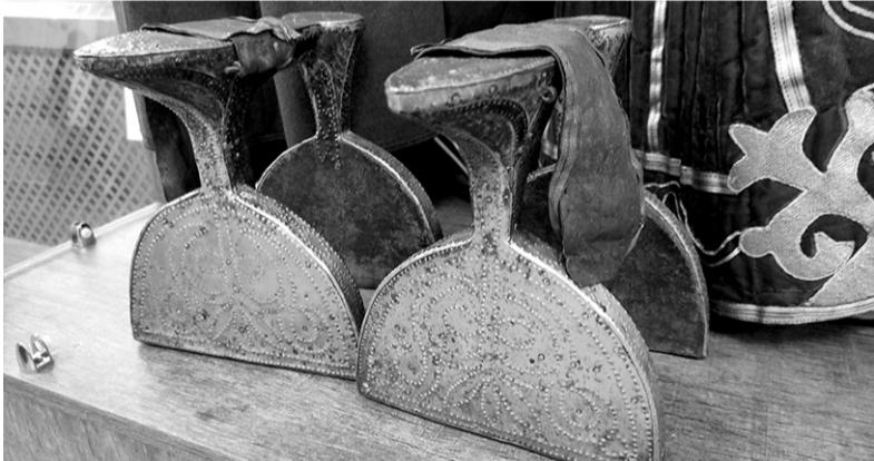
На свадьбу ходули могла надеть невеста и не из высшего сословия

В некоторых случаях под ступней обуви укрепляли металлические звенящие подвески.